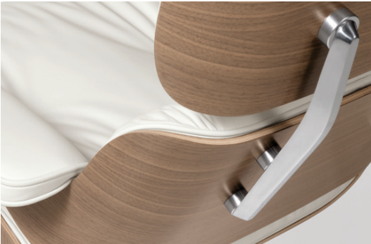
Die Metallteile sind aus poliertem Aluminium.