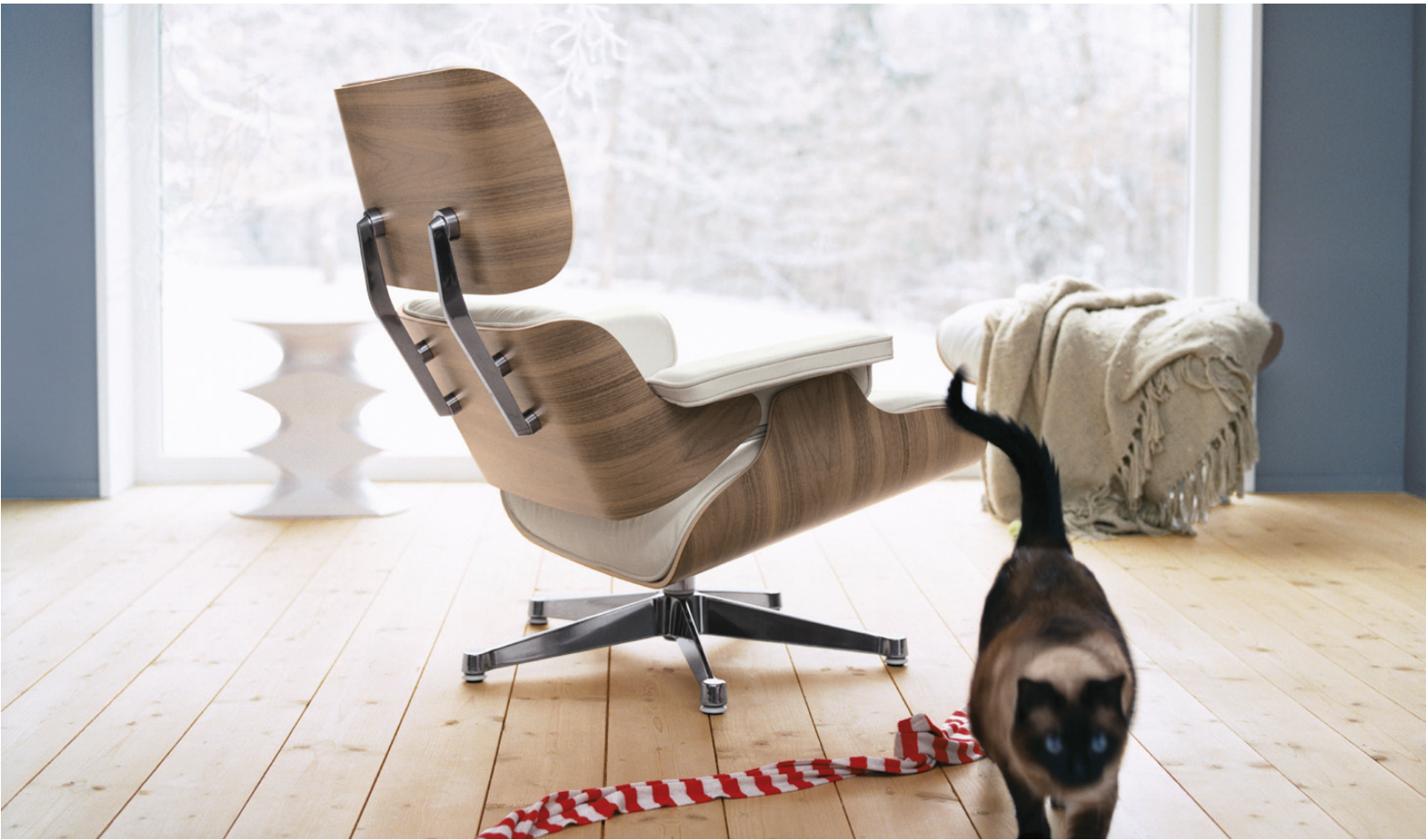
Die frische Anmutung des weissen Lounge Chair ist auf helle Interieurs ausgelegt.

Ursprünglich durch den traditionellen englischen Clubsessel inspiriert, definierten die Eames den Lounge Chair in dunklem Furnier und schwarzem Leder, variierten ihn aber schon bald in einer Version mit hellen Lederpolstern. Zusammen mit dem Eames Office hat Vitra eine in allen Elementen aufeinander abgestimmte helle Version dieses Klassikers entwickelt, die hervorragend in zeitgemässe Interieurs passt.