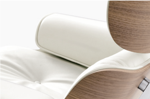
Das Leder ist in einem leicht gebrochenen Weiss gehalten.