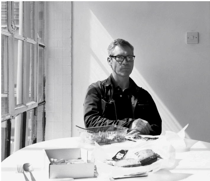
Jasper Morrison , born in London in 1959, studied design at Kingston Polytechnic School and continued his studies at the Royal College of Art. In 1986 he opened a design office in London. His range of outstanding works can be found worldwide in the collections of various museums, including the Museum of Modern Art in New York.

Jasper Morrison , geboren 1959 in London, studierte Design an der Kingston Polytechnic School und bildete sich am Royal College of Art weiter. 1986 eröffnete er in London ein Designbüro. Seine vielfach ausgezeichneten Arbeiten sind weltweit in den Sammlungen verschiedener Museen, einschliesslich des Museum of Modern Art in New York, zu finden.