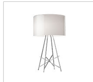
Ray T swi design by Rodolfo Dordoni

Tischleuchte für den Innenbereich mit diffusem Licht.