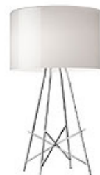
Ray T Dim design by Rodolfo Dordoni

Tischleuchte für den Innenbereich mit diffusem Licht.